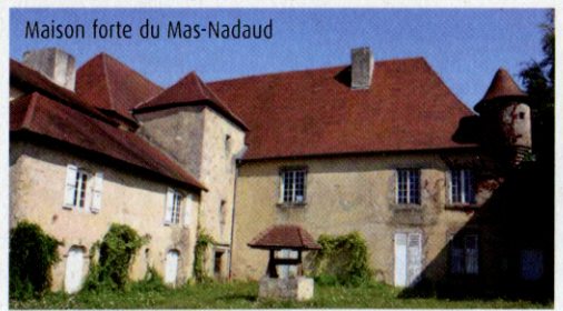
Maison forte du Mas-Nadaud